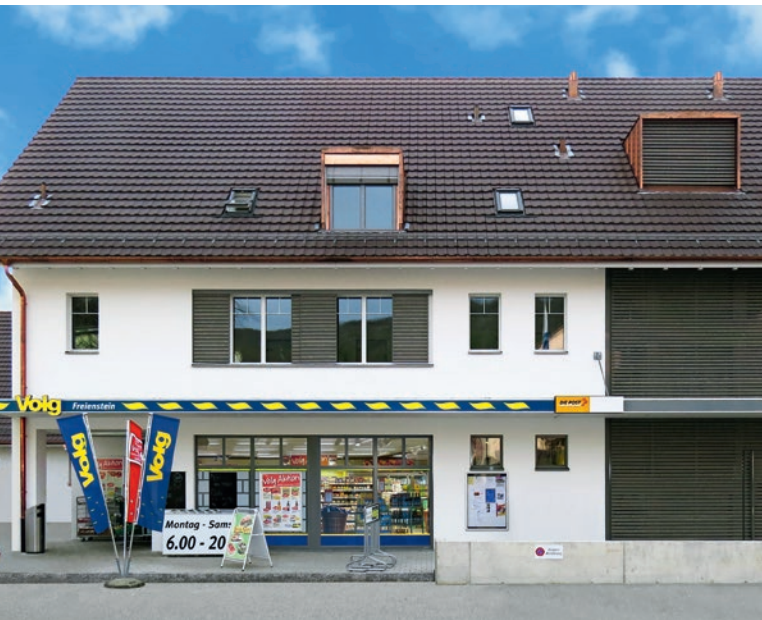
Im Dorf daheim: der neue Volg-Laden in Freienstein ZH.