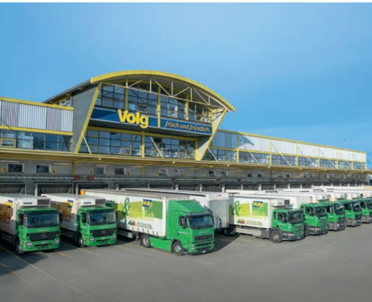
Volg-Verteilzentrale in Winterthur