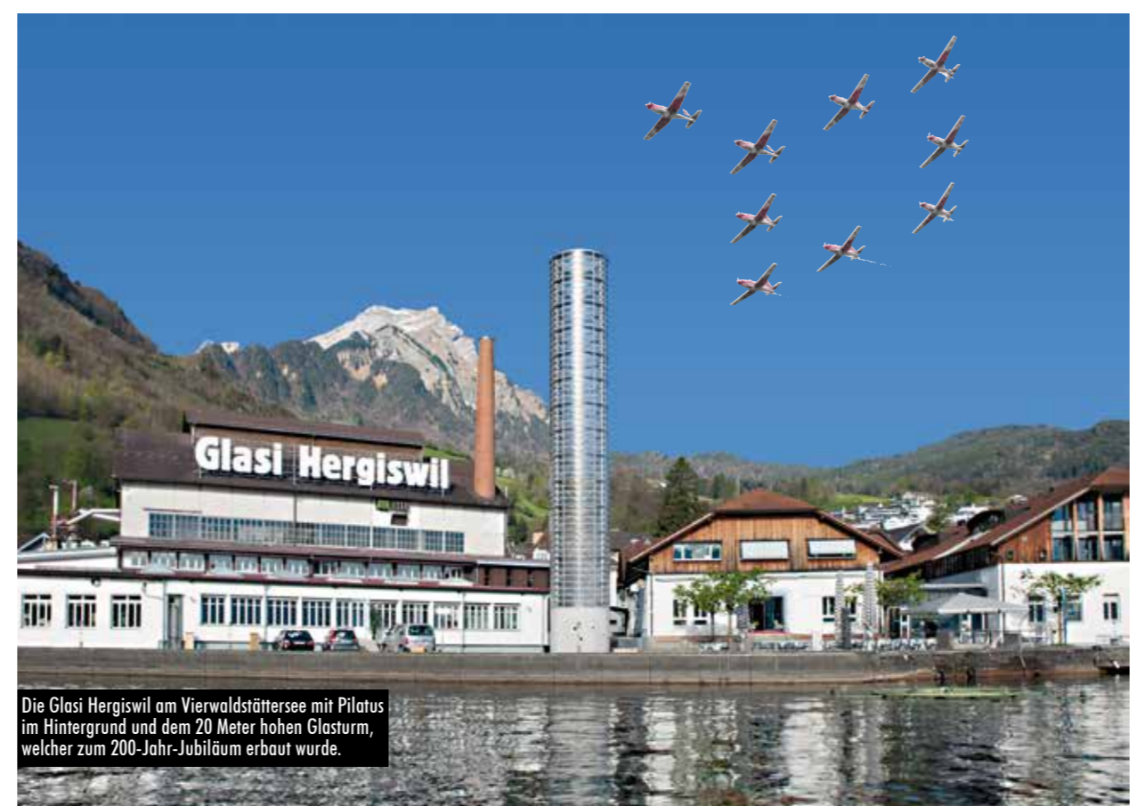
Die Glasi Hergiswil am Vierwaldstättersee mit Pilatus im Hintergrund und dem 20 Meter hohen Glasturm, welcher zum 200-Jahr-Jubiläum erbaut wurde.