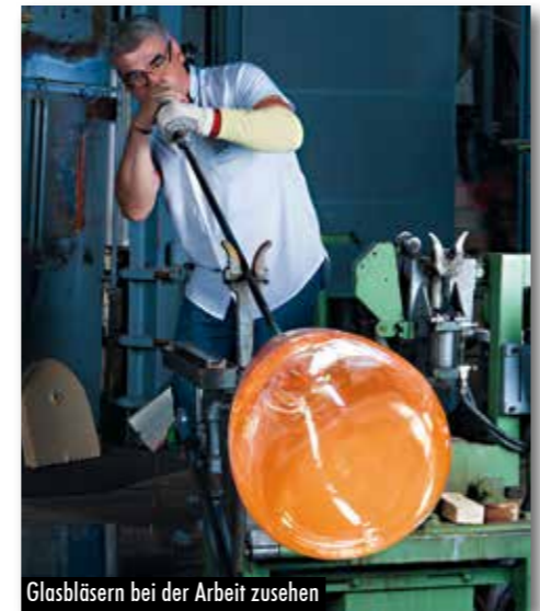
Glasbläsern bei der Arbeit zusehen

HERGISWILER GLAS AG Seestrasse 12, 6052 Hergiswil am See Fon 041 632 32 32 info@glasi.ch