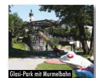
Glasi-Park mit Murmelbahn