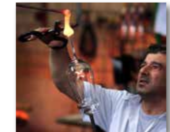
Selber eine Glaskugel blasen