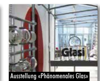
Ausstellung «Phänomenales Glas»