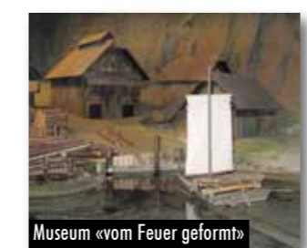
Museum «vom Feuer geformt»