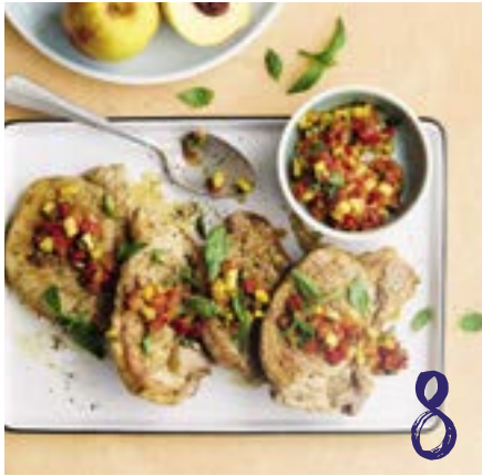
Ösi Chuchi Sommerfrüchte fürs gewisse Etwas im Hauptgericht