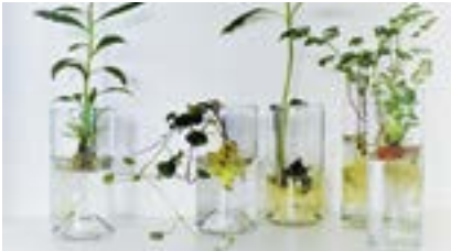
VOLG ERLEBNISHOF WITTAU AG 19. August (2 Halbtageskurse)

Machen, schaffen und das Wissen erweitern in ländlicher Umgebung: Das bieten die Volg NATURENA Erlebnishöfe an fünf Standorten in der Schweiz.