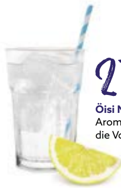
Ösi Marke Aromatische Durstlöcher: die Volg Limonaden