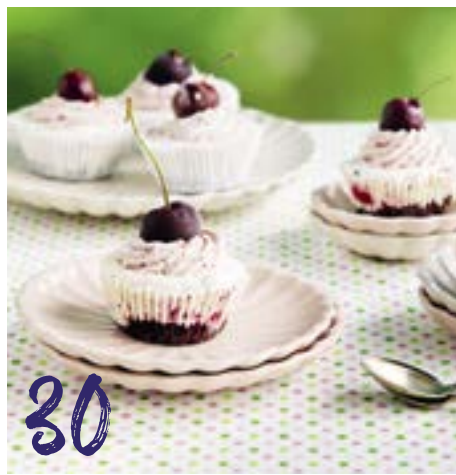
Ösi Chuchi Süss, eiskalt und einfach zum Verlieben: Desserts mit Glace