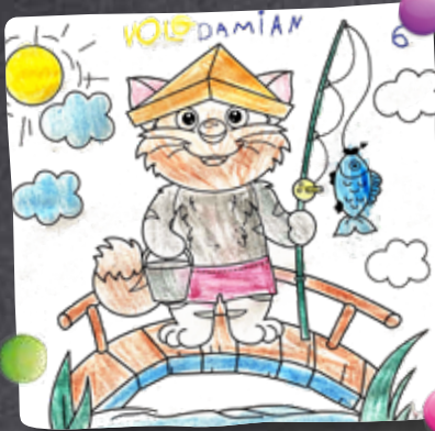
Damian (6) aus Hirzel