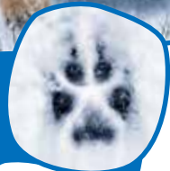
Fussabdruck von einem Wolf