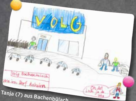
Tanja (7) aus Bachenbülach

Wo bleibt denn mein Besitzer? Ich habe Hunger!